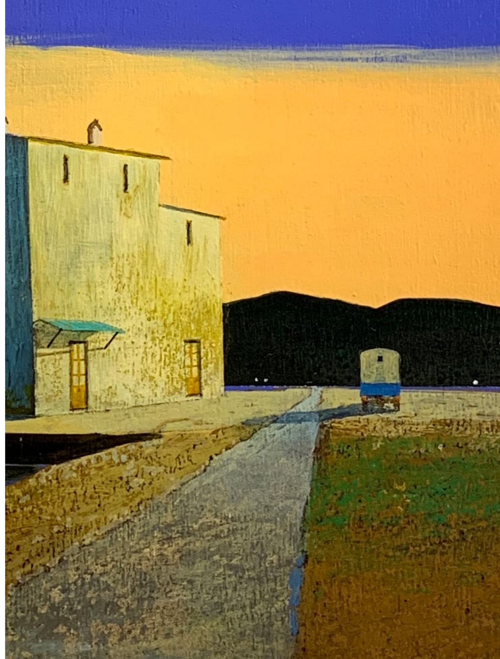
Quasi certo Olio su tavola / Oil on wood Cm. 60x60, 2019