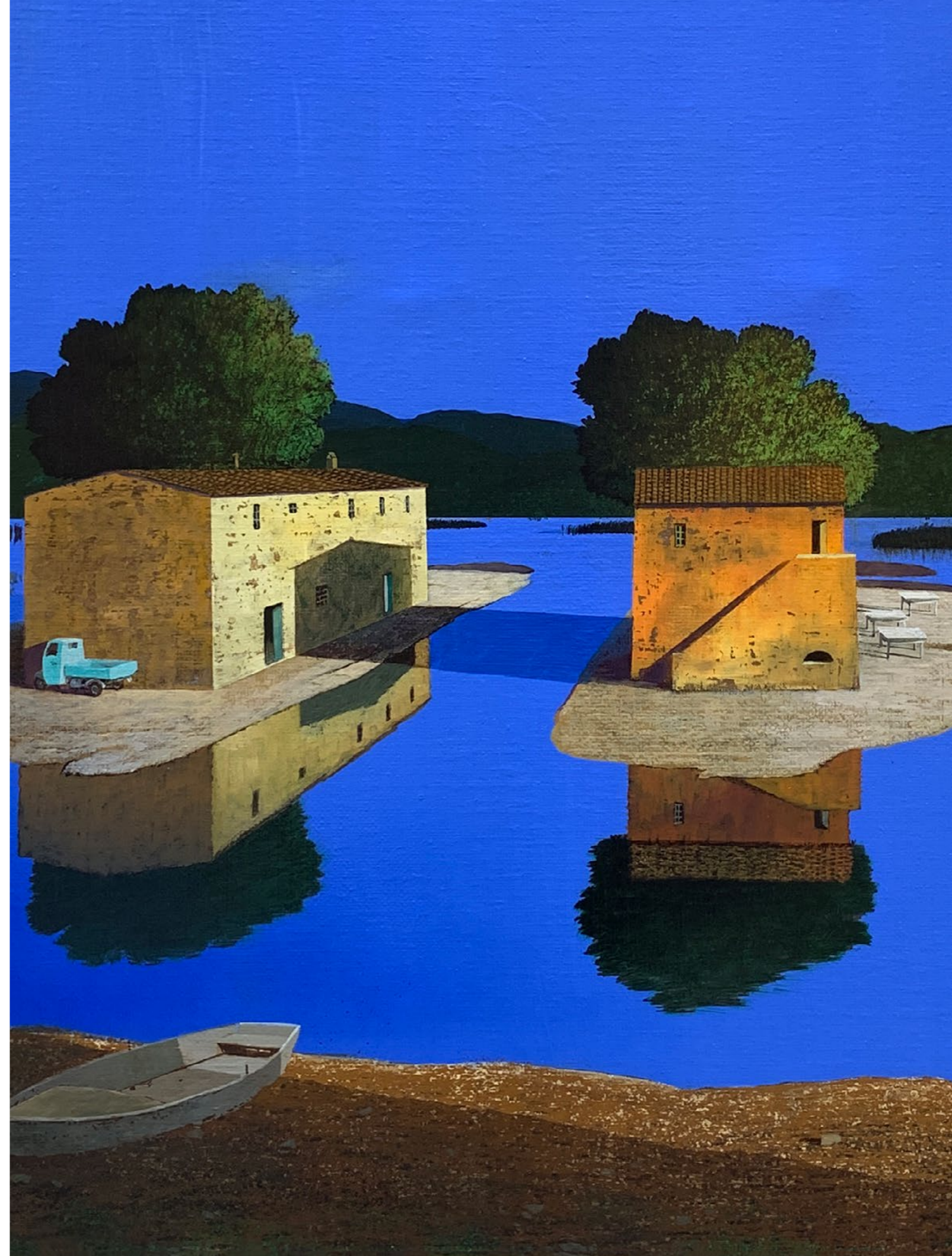
La barca di tutti Olio su tela / Oil on canvas Cm. 100x100, 2019