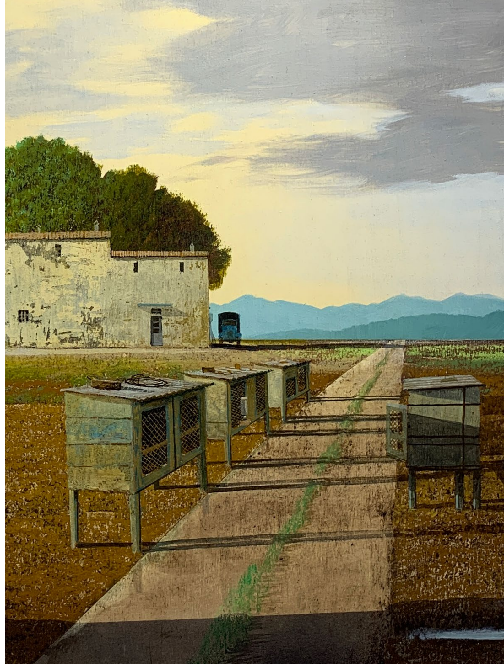
Il giorno dopo Olio su tavola / Oil on wood Cm. 60x60, 2019