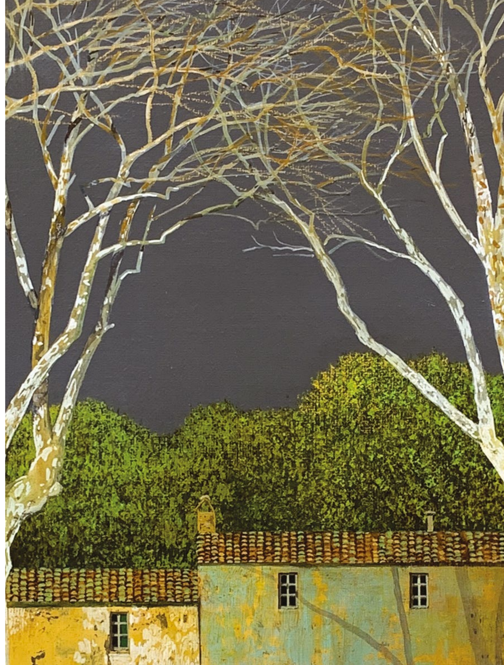
Ombre lunghe Olio su tela / Oil on canvas Cm. 100x100, 2019