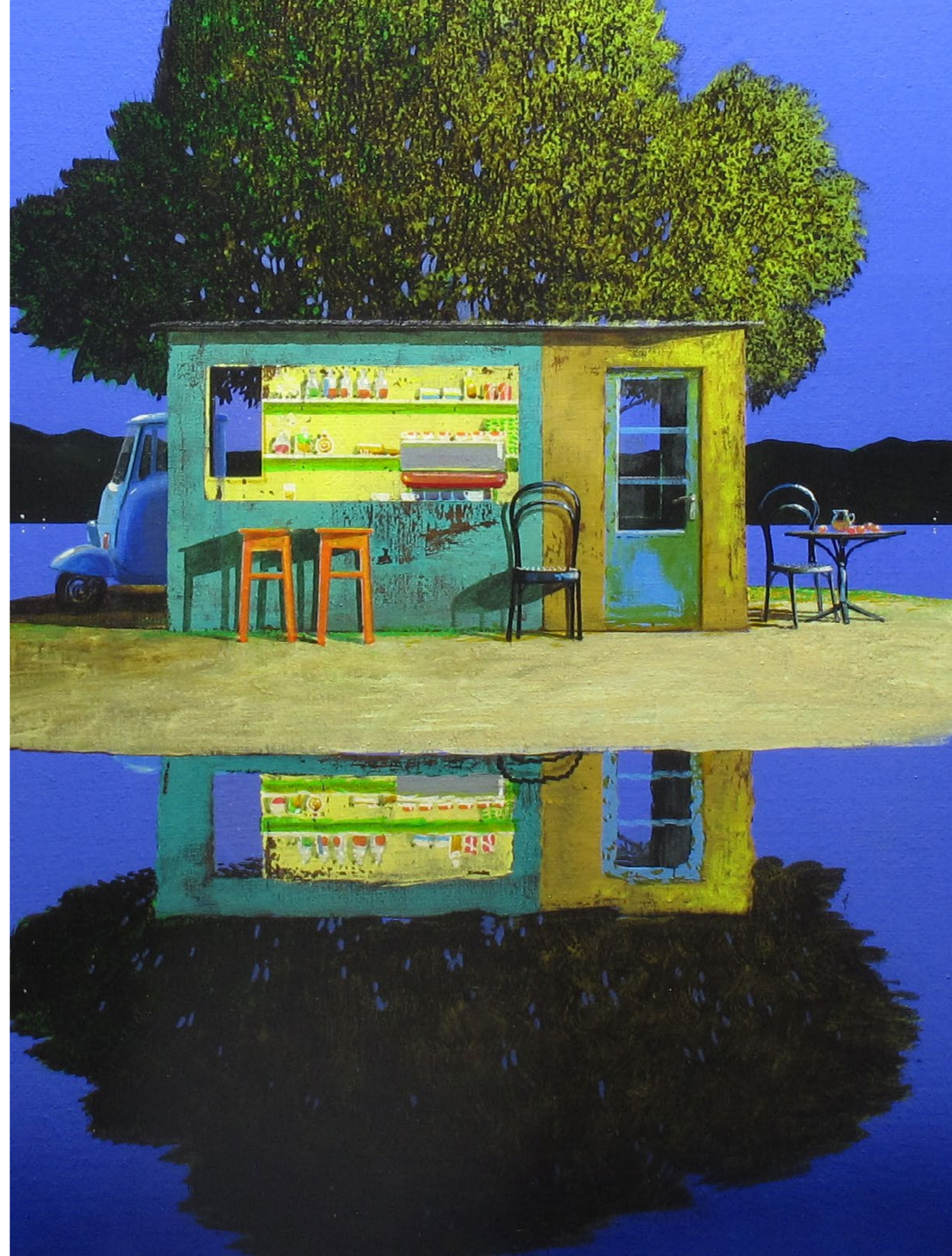
L'ultimo bar Olio su tela / Oil on canvas Cm. 100x100, 2019