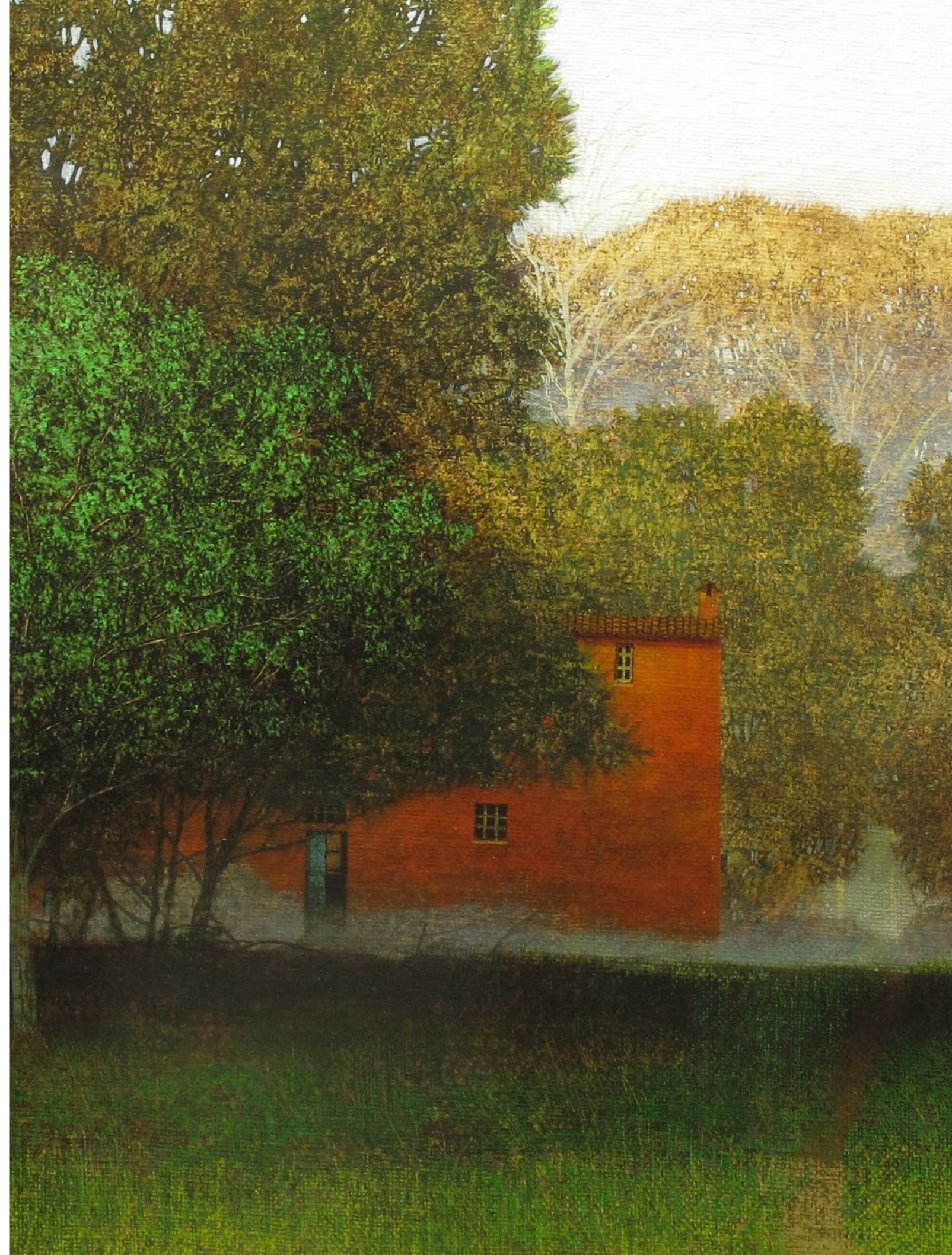
La macchia III Olio su tela / Oil on canvas Cm. 80x80, 2019