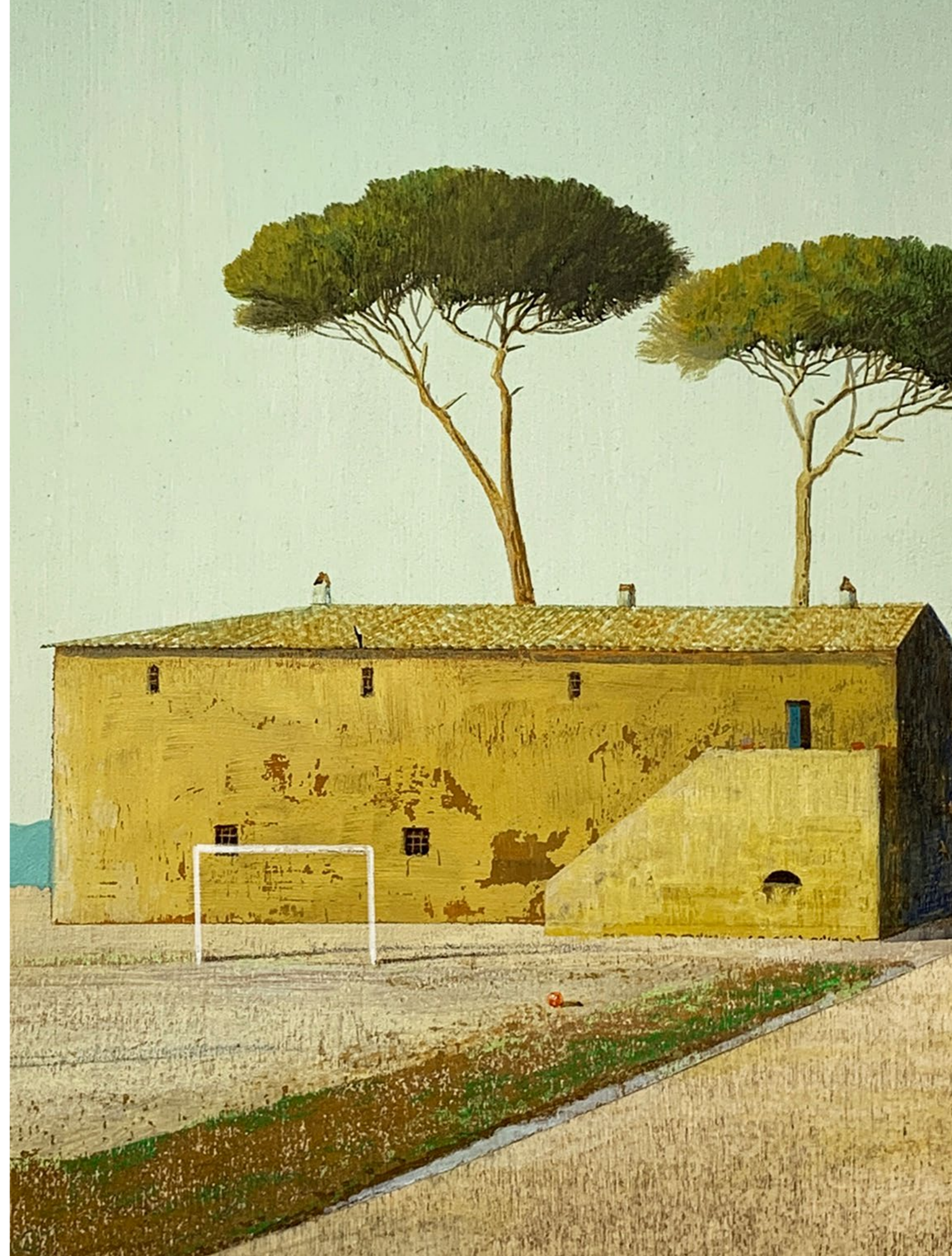
Il senso del tempo Olio su tavola / Oil on wood Cm. 50x50, 2019