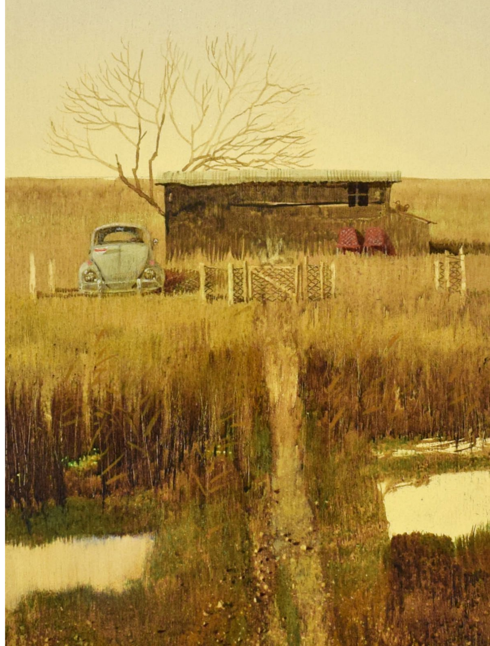
Quel che sembra Olio su tavola / Oil on wood Cm. 60x60, 2018