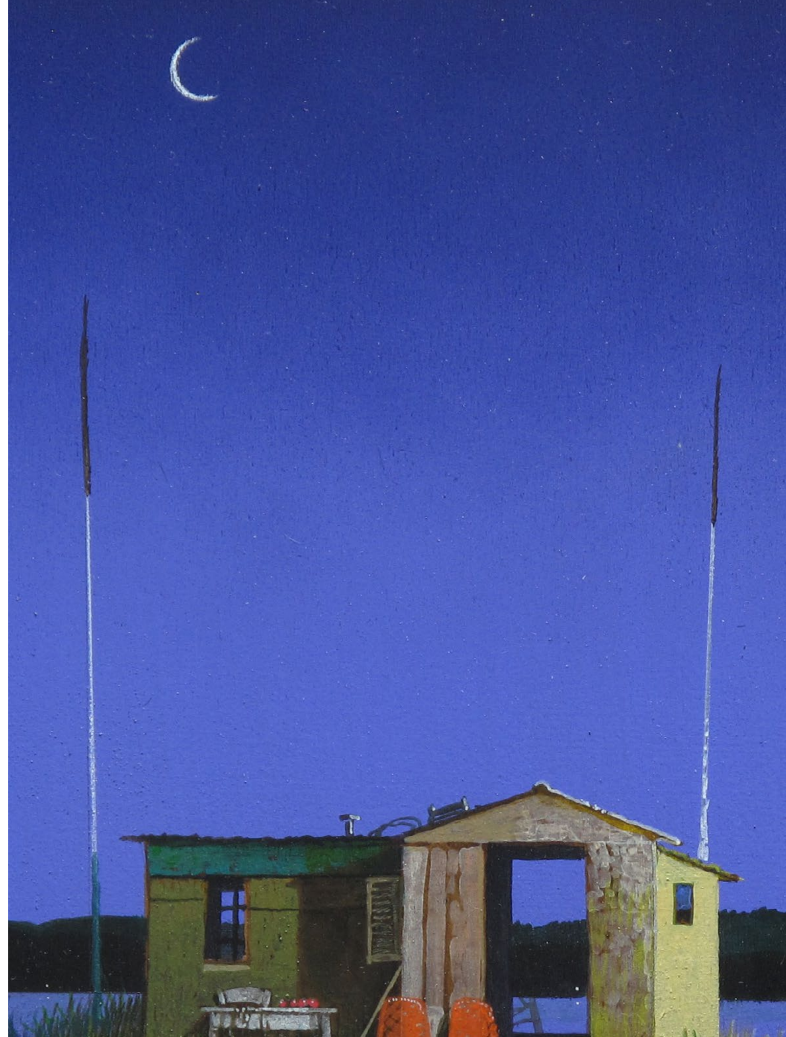
Mezza sera Olio su tavola / Oil on wood Cm. 40x40, 2019