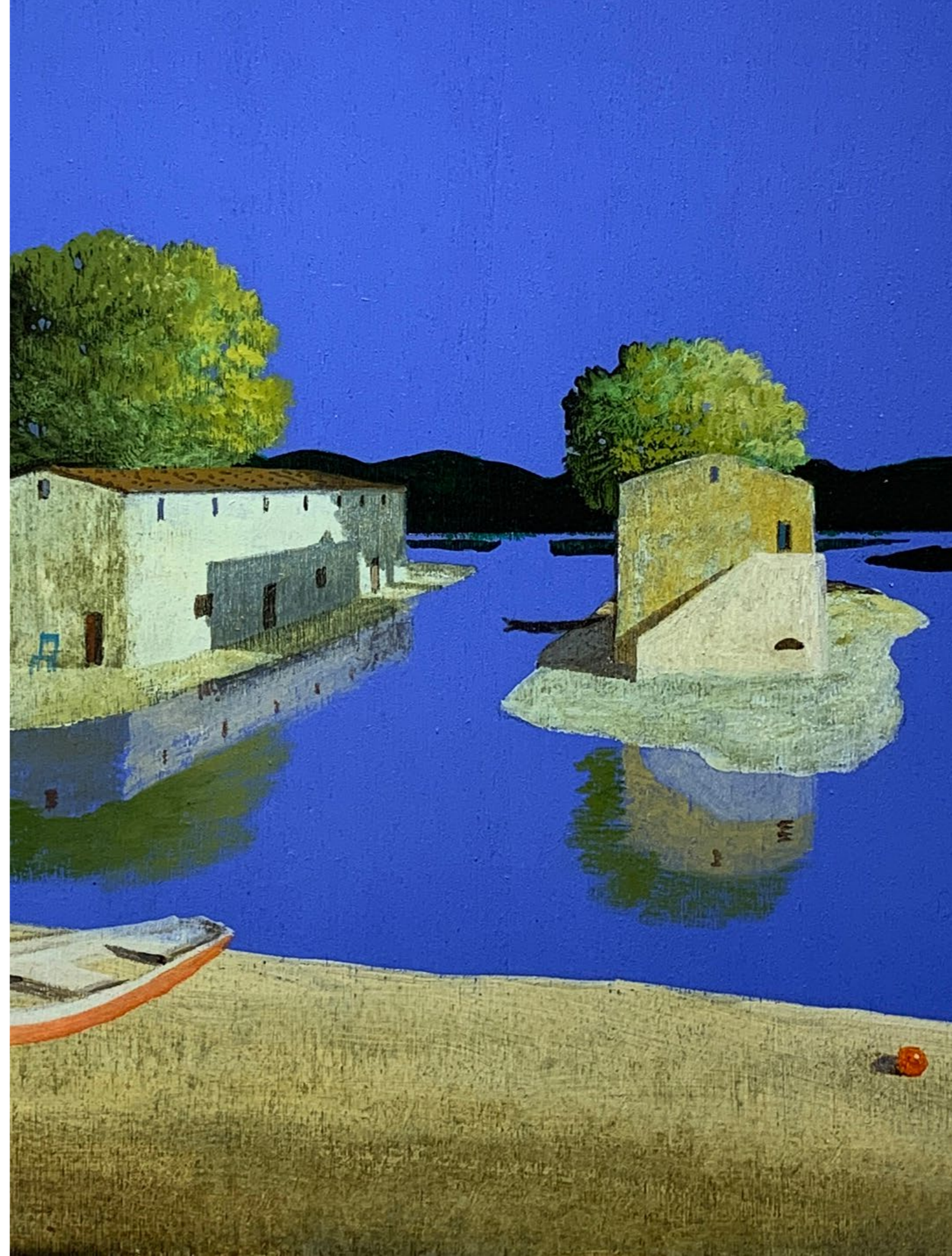
Isole Olio su tavola / Oil on wood Cm. 40x40, 2019