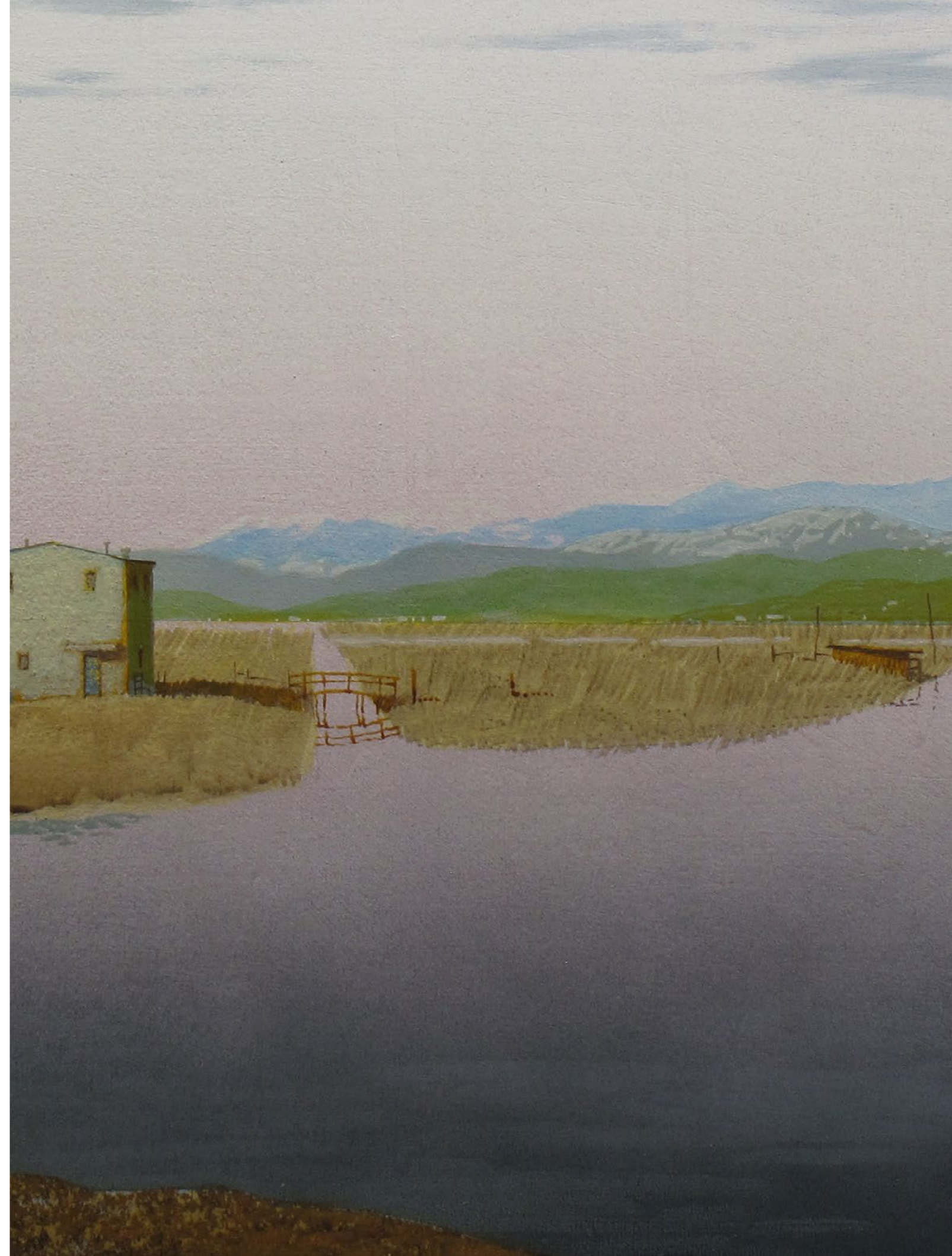
La certezza Olio su tavola / Oil on wood Cm. 50x50, 2019