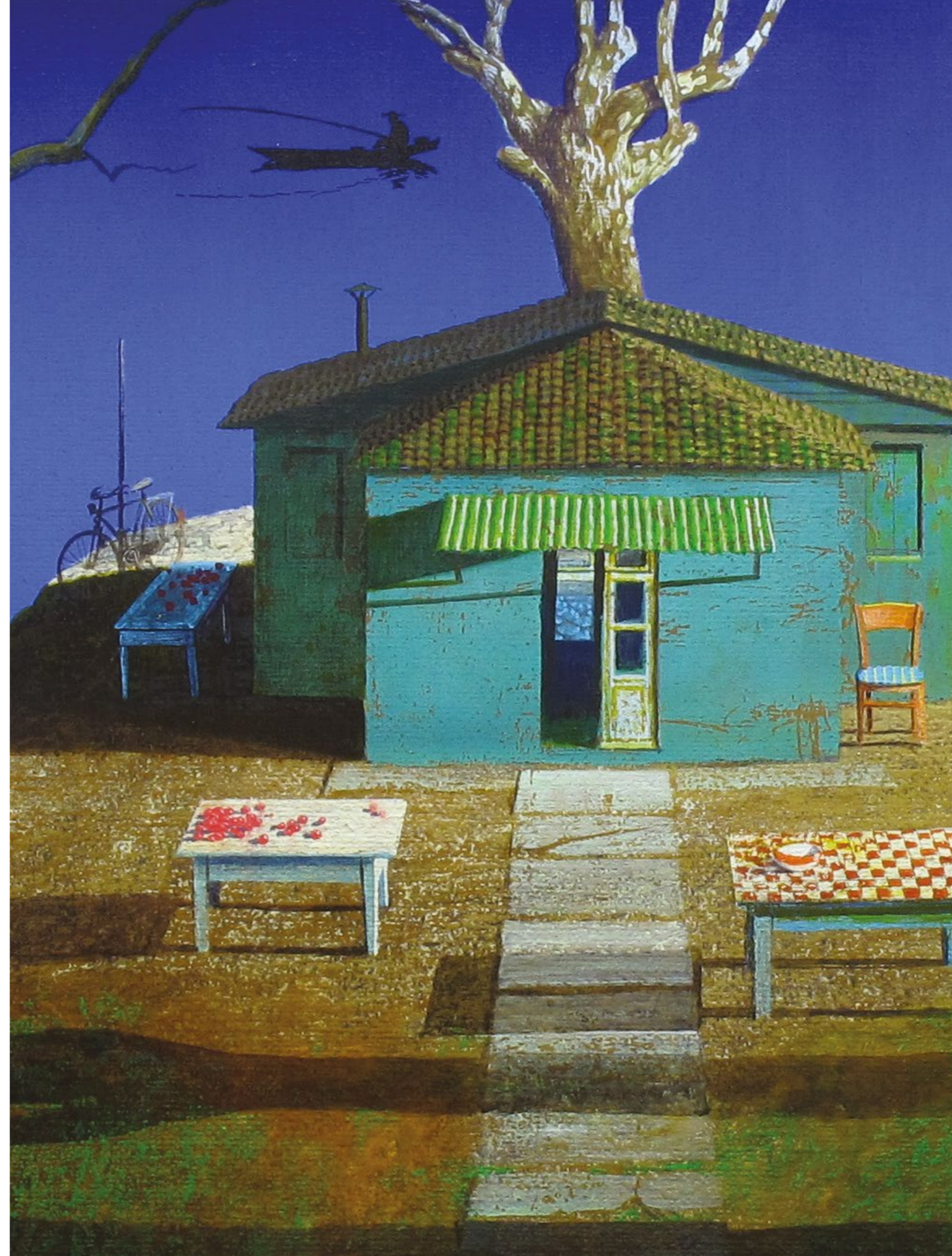
Dove si sta bene Olìo su tela / Oil on canvas Cm. 100x100, 2019