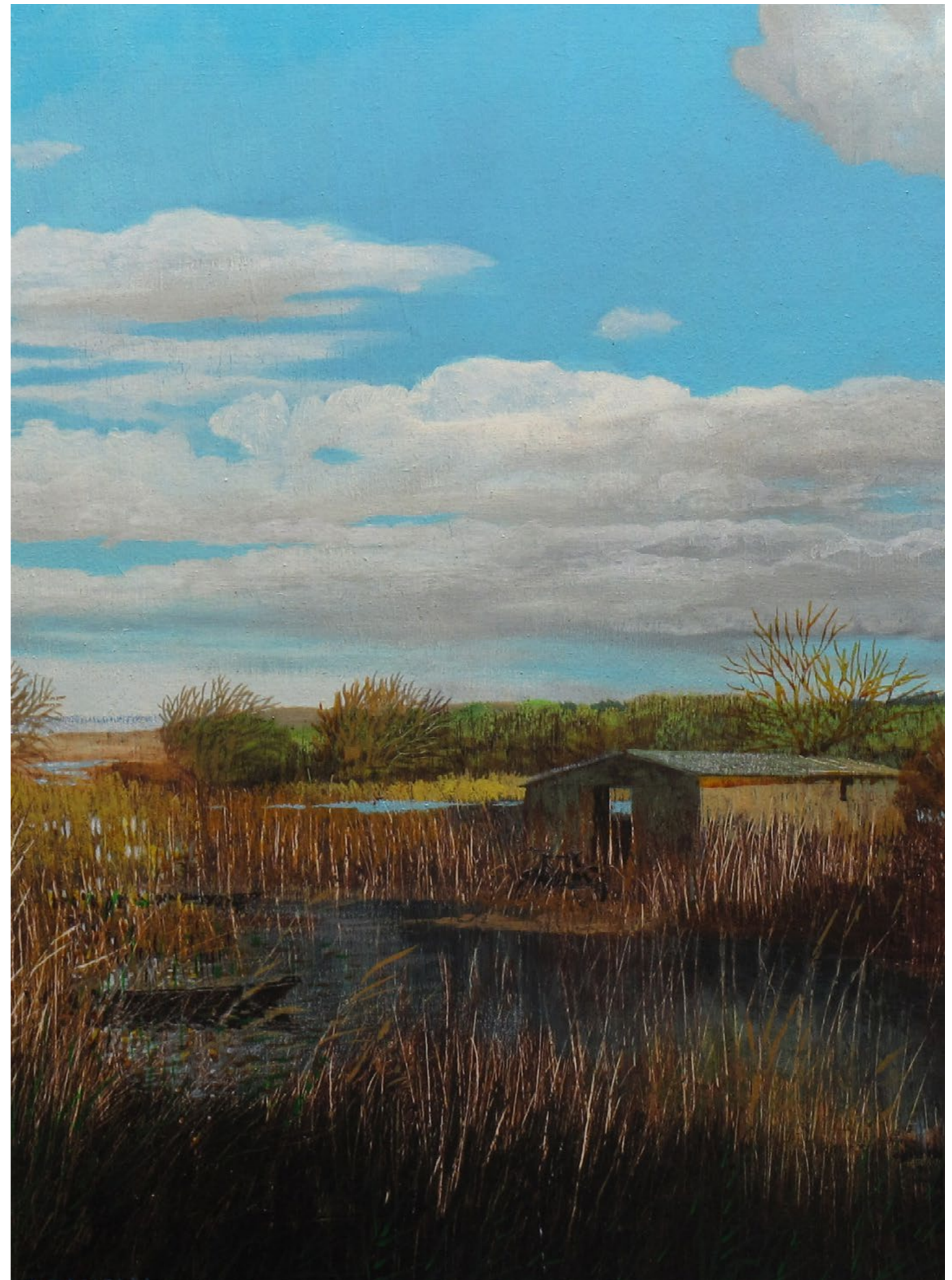
Capanno a San Rossore Olio su tavola / Oil on wood Cm. 50x50, 2019