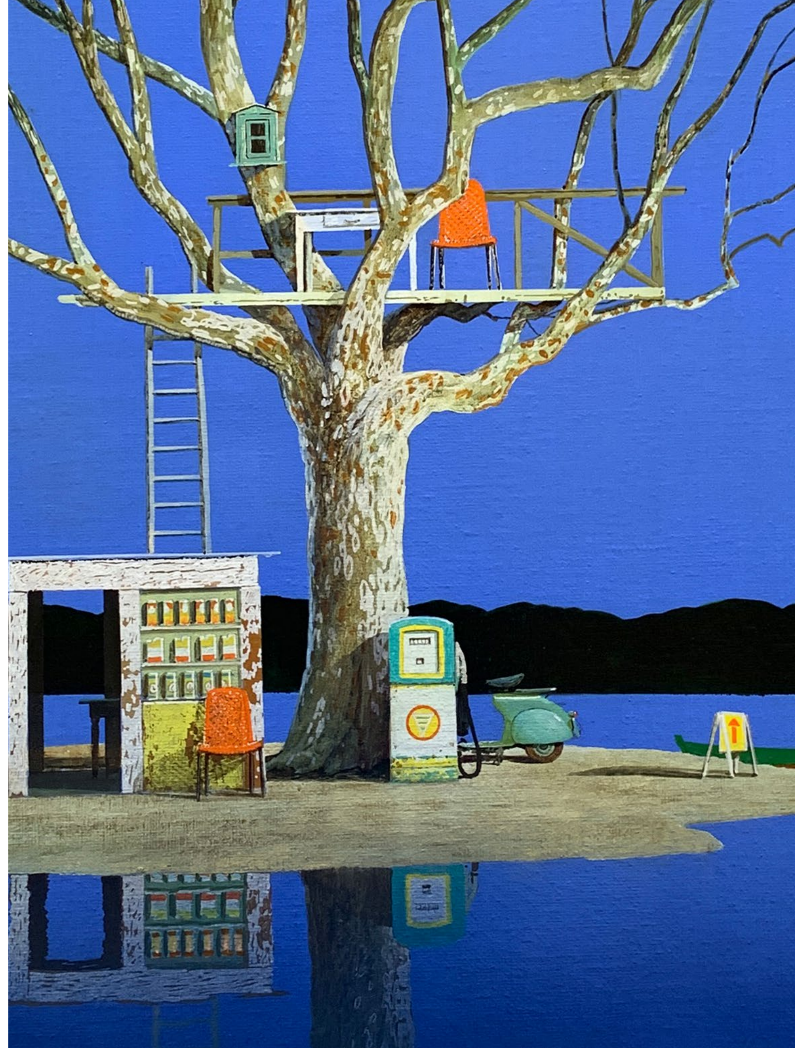
Il punto di vista Olio su tela / Oil on canvas Cm. 100x100, 2019