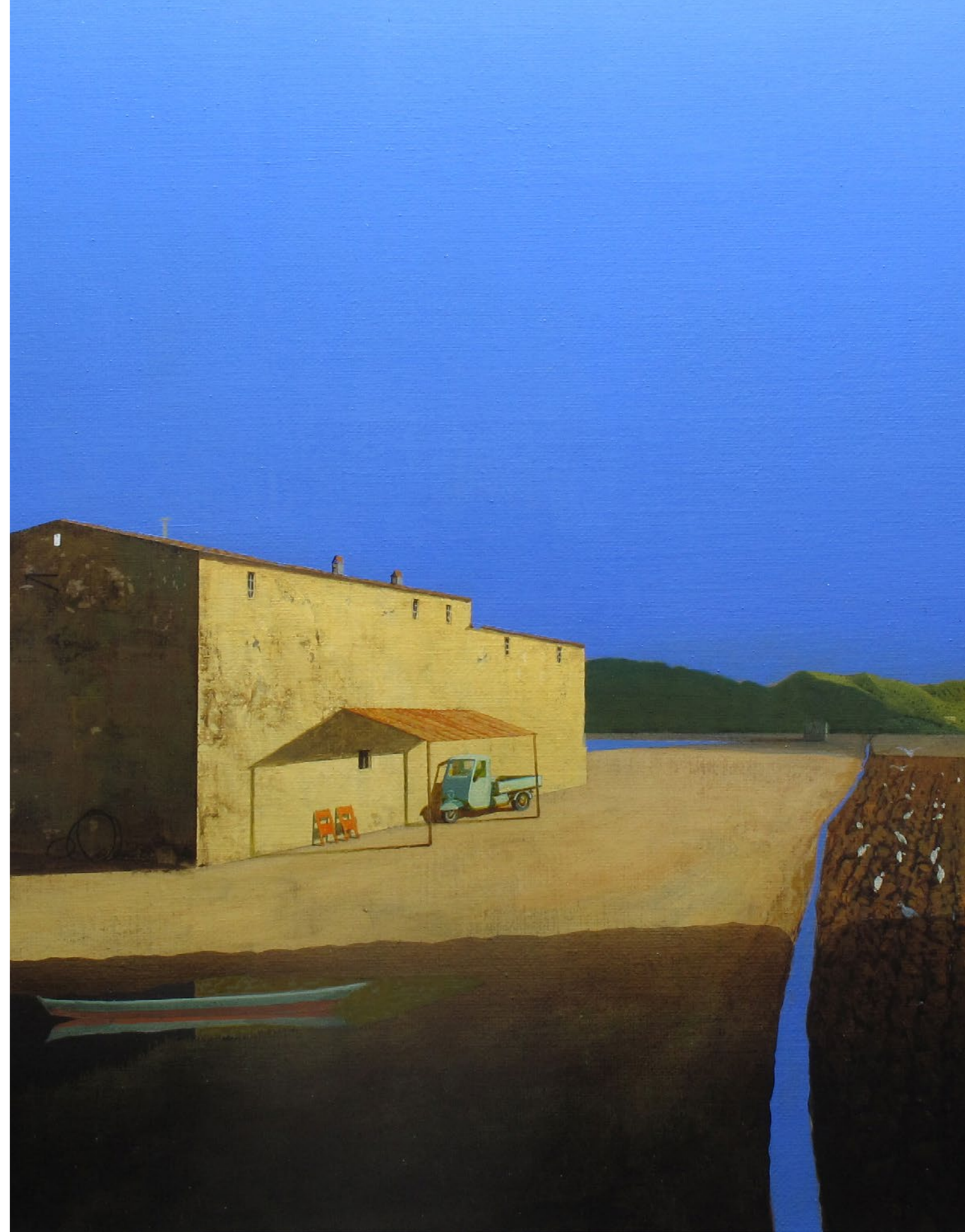
Ora incerta Olio su tela / Oil on canvas Cm. 80x80, 2019