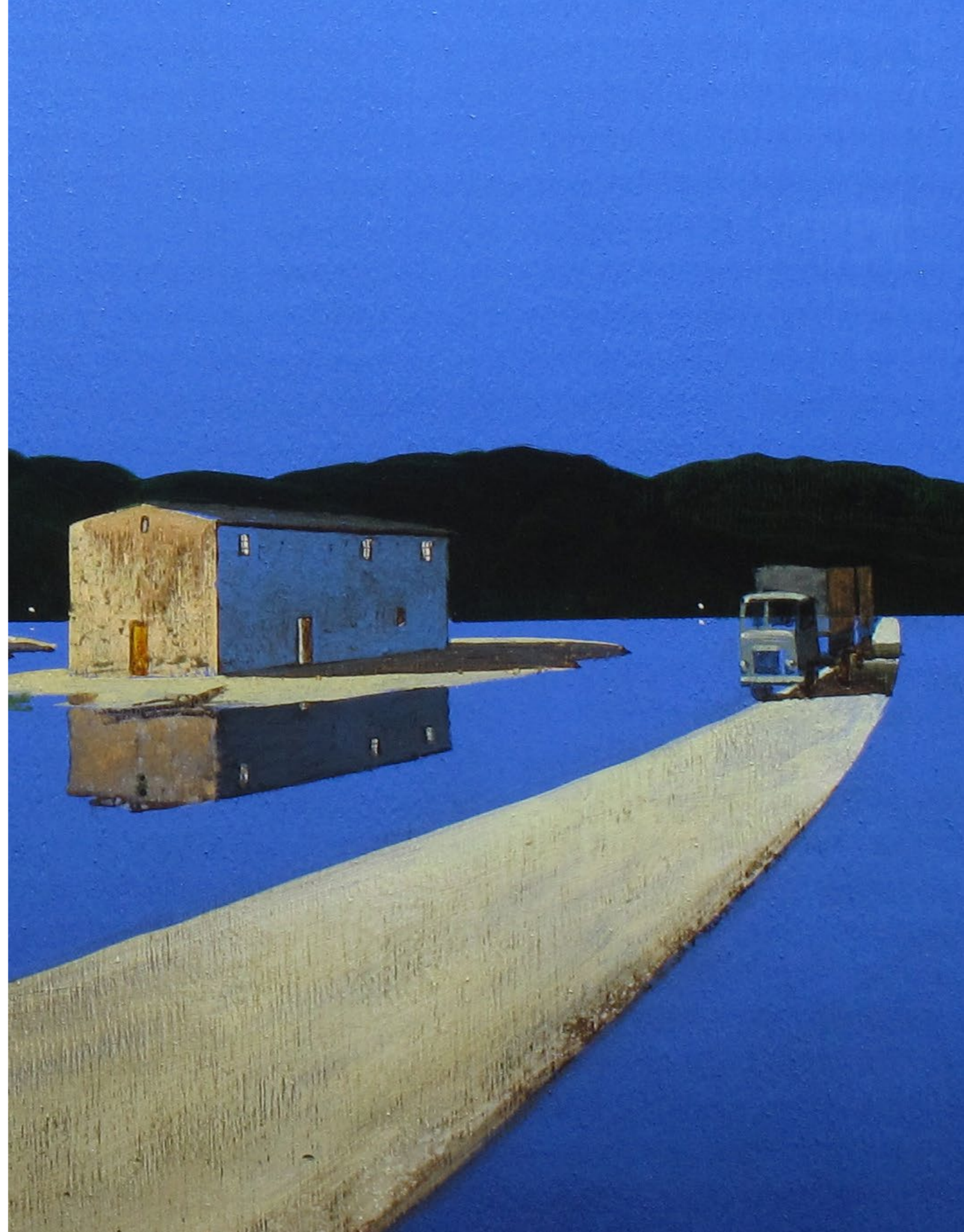
Il ritorno Olio su tavola / Oil on wood Cm. 60x60, 2019